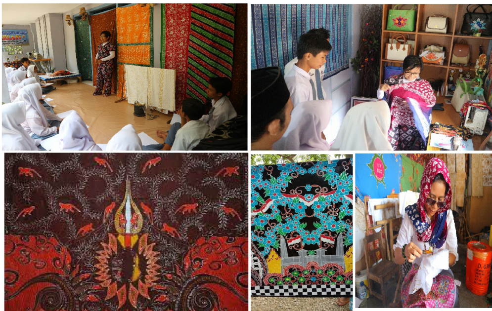
Gambar 1 Pemberdayaan Masyarakat Jelgung Galeri Sri Krisna