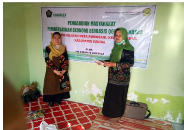
Gambar 2 Pelatihan Kewirausahaan dan Manajemen Keuangan Bisnis ( Qardhul Hasan )

Strategi pemberdayaan ekonomi masyarakat melalui instrumen Qardhul Hasan sangat tepat diberikan sebagai solusi terhadap duafa yang kesulitan mendapatkan modal melalui lembaga keuangan formal, karena mereka tidak mempunyai "jaminan" dan tidak mampu menyusun laporan keuangan secara standar. Al-Shami et al., (2017) menyatakan bahwa micro credit termasuk Qardhul Hasan sebagai instrumen keuangan yang efektif untuk menangani kesulitan keuangan rumah tangga melalui pemberdayaan perempuan, terutama mereka yang hidup dalam kemiskinan dan tidak bisa akses ke pemberi pinjaman keuangan formal karena kerentanan ekonomi mereka. Osman (2016) menyatakan bahwa Qardhul Hasan sebagai instrumen untuk mengurangi kemiskinan dan masalah-masalah sosial. Qardhul Hasan berasal dari dana zakat, infak, dan sedekah. Jika jumlah dana Qardhul Hasan dapat dikumpulkan dalam jumlah yang lebih besar maka akan semakin besar turunya kemiskinan dan semakin tinggi peluang kerja yang dapat diciptakan. Zakat, sedekah, dan Qardhul Hasan bisa digunakan untuk mendukung bisnis sosial. Qardhul Hasan mendukung berjalannya model bisnis sosial untuk pembangunan berkelanjutan dan lebih besar memberikan kemanfaatan bagi kesejahteraan masyarakat (Aydin, 2013).