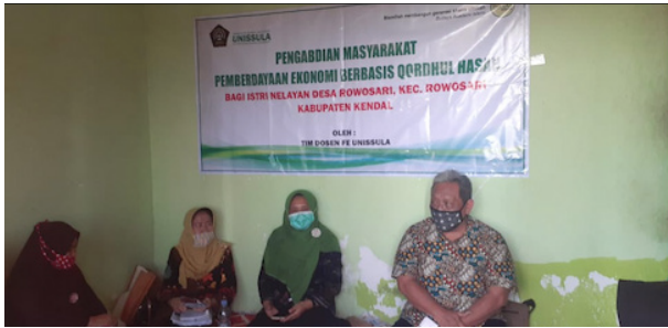
Gambar 3 Pelatihan Kewirausahaan dan Manajemen Keuangan