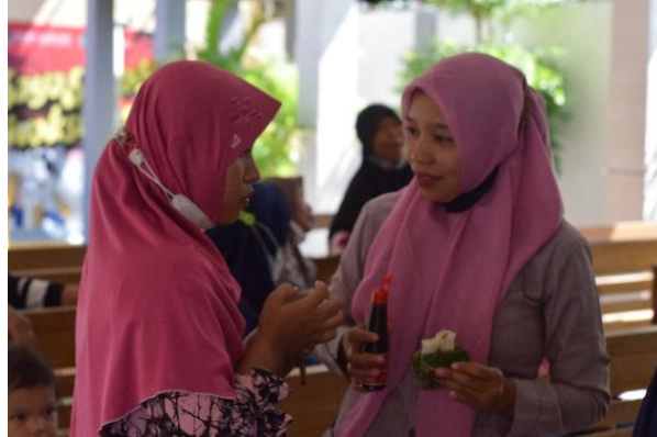
Gambar 5. Implementasi produk kecap pada makanan

Hasil kuisisioner monitoring dan evaluasi kepada masyarakat di sajikan pada gambar 6, pada point (a) banyak pohon lamtoro di sekitar rumah mereka, sebanyak 6 orang sangat setuju, 11 orang setuju, 4 orang tidak setuju dan tidak ada orang yang memilih sangat tidak setuju, hal itu membuktikan bahwa pohon lamtoro banyak tumbuh di sekitar pemukiman warga, pada point (b) setelah dilakukan pelatihan ibu-ibu PKK mengetahui kandungan dan potensi lamtoro, 8 orang memilih sangat setuju, 10 orang sangat setuju dan 3 orang tidak setuju, hal ini membuktikan bahwa ibu-ibu PKK mengetahui kandungan dan potensi lamtoro, point (c) sebanyak 4 orang sangat setuju, 15 orang setuju dan 3 orang masih belum memahami mekanisme pembuatan kecap dari lamtoro, point (d) sebanyak 12 orang sangat setuju, 8 orang setuju dan 1 orang memilih tidak setuju bahwa bahan baku kecap lamtoro bisa menjadi bahan baku alternatif kedelai, dikarenakan bahan kedelai harganya relatif mahal, serta point (e) ibu-ibu PKK sebanyak 1 orang setuju, 2 orang tidak setuju, dan 18 orang sangat tidak setuju, dikarenakan bahan baku dan peralatan yang sangat mudah di peroleh dan hampir semua masyarakat memiliki. Hasil kuisisioner membuktikan bahwa dengan adanya program ini pengetahuan masyarakat semakin meningkat tentang potensi biji lamtoro serta memahami cara pengolahan biji lamtoro menjadi kecap.