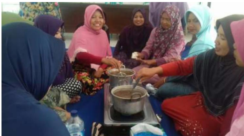
Gambar 3. Pendampingan produksi mandiri kecap lamtoro

Penghimpauan produksi mandiri dan pendampingan di lakukan selama 2 minggu sekali. Tim pengabdian menghimbau kepada ibu-ibu PKK untuk melakukan produksi secara mandiri kediaman rumah masing-masing setelah di lakukan sosialisasi dan pelatihan pembuatan kecap dari lamtoro, pada produksi kecap terdapat tahapan inkubasi menggunakan bantuan enzim bromelin dari nanas, sehingga tahap inkubasi ini di sarankan oleh tim pengabdian untuk di lakukan ibu-ibu PKK di rumah, dan hasil inkubasi dibawa ke balai desa untuk untuk tahap proses pembuatan kecap selanjutnya yang dapat di pantau sekaligus di dampingi langsung oleh tim pengabdian. Bimbingan dan pendampingan di lakukan di balai desa kaliploso yang meliputi pendampingan proses pembuatan, konsultasi produk, dan konsultasi biaya.