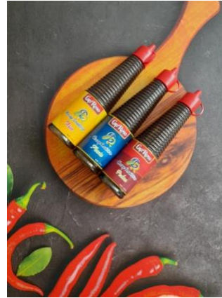
Gambar 8. Produk Kecap dari lamtoro