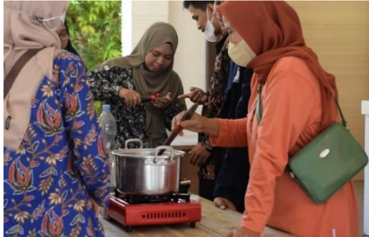
Gambar 2. Pelatihan Pembuatan Kecap dari Lamtoro

Bahan yang di tambahkan memiliki fungsi yang berbeda-beda, jika salah satu bahan tidak di masukkan atau di ikut sertakan pada proses pembuatan, maka yang terjadi pada kecap menghilangkan salah satu faktor yang mendukung dari keberhasilan pada kecap lamtoro. Penambahan setiap varian rasa yang di targetkan memilik komposisi yang berbeda-beda untuk mendapatkan cita rasa kecap lamtoro yang baik dan layak di konsumsi oleh masyarakat.