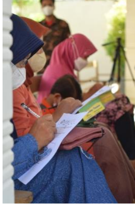
Gambar 4. Pengisian angket/kuisisioner untuk Evaluasi

untuk mengetahui tingkat keberhasilan dari serangkaian program yang telah di lakukan, dan melakukan perbaikan serta evaluasi jika terdapat kekuaran selama program.