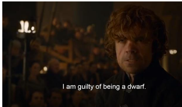
Gambar 10. Adegan saat Tyrion sedang disidang oleh Tywin dan Cersei Lannister atas tuduhan yang tidak ia lakukan (season 4, episode 5)