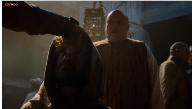
Gambar 13. Adegan yang menunjukkan saat kepala Tyrion Lannister diusap-usap oleh penjaga rumah bordil di Volantis karena dianggap memiliki kesaktian (season 5, episode 3)