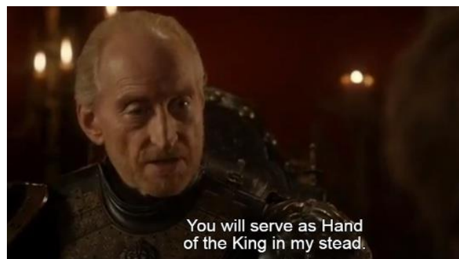
Gambar 14. Adegan saat Tywin Lannister menunjuk Tyrion Lannister sebagai Hand of The King (season 1, episode 10)

Gambar 13 di atas, secara representational meaning , adegan ini merepresentasikan bahwa Tyrion dianggap sebagai seorang yang sakti sehingga untuk mendapatkan kesaktian atau keberuntungan dari tokoh difabel seperti Tyrion adalah dengan cara menggosok atau mengusap kepala seorang difabel yang bertubuh kerdil. Hal ini terlihat pada adegan 1 sebagai offer picture , dengan posisi tangan penjaga rumah bordil yang berada di atas kepala Tyrion dengan pengambilan gambar angle close up (dari kepala hingga pundak) sambil mengatakan " it's good to rub a dwarf's head " (adalah keberuntungan mengusap-usap kepala seorang dwarf). Secara compositional meaning , dengan posisi Tyrion yang berada di sebelah kiri sebagai bentuk dari given yaitu menggambarkan sesuatu yang telah ada di benak penonton, bahwa difabel seperti Tyrion, erat kaitannya dengan kekuatan magis (Pritchard, 2017).