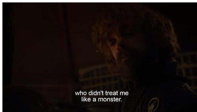
Gambar 11. Adegan yang menunjukkan hubungan Tyrion dengan saudara laki-lakinya Jaime (season 8, episode 5)