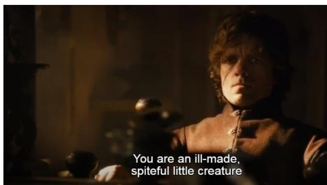
Gambar 12. Adegan yang menunjukkan Tywin Lannister menganggap Tyrion Lannister sebagai aib, kutukan, dan hukuman yang diberikan dewa-dewa (season 3, episode 1)

Gambar 11 di atas menampilkan hubungan Tyrion dengan saudara laki-laknya Jaime. Momen ini merupakan momen yang mengharukan, menyentuh dan sangat emosional antara Tyrion dan Jaime. Jaime adalah satu-satunya anggota keluarga Lannister yang menyayangi Tyrion. Sebagai offer picture, adegan ini dominan menggunakan angle close up yang menggambarkan adanya hubungan personal antar represented participant . Adegan di atas menawarkan ( offer ) informasi bahwa Tyrion memiliki hubungan yang dekat dengan Jaime, berbeda dengan hubungannya dengan ayah dan saudara perempuannya Cersei. Kalimat Tyrion yang mengatakan " you were the only one who didn't treat me like a monster " merepresentasikan bahwa Jaime tidak pernah memperlakukan Tyrion sebagai monster sebagaimana yang Cersei dan Tywin lakukan, bahkan jika bukan karena Jaime, mungkin Tyrion akan mati, entah karena dibunuh atau bunuh diri. Secara compositional meaning , penempatan Tyrion yang berada di sebelah kanan sebagai bentuk dari new information value bahwa ini adalah bentuk representasi difabel yang baru, di mana seorang difabel digambarkan memiliki hubungan yang dekat layaknya sahabat dengan saudara kandungnya sendiri, tidak seperti pada film Indonesia yang berjudul My Idiot Brother (2016) yang menceritakan tentang adik bernama Angel yang malu memiliki kakak laki-laki seorang difabel mental.