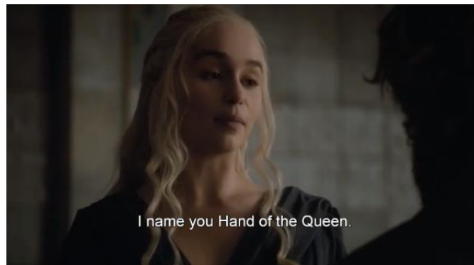
Gambar 16. Adegan saat Daenerys menunjuk Tyrion Lannister sebagai Hand of The Queen (season 6, episode 10)

Gambar 14, gambar 15, dan gambar 16 di atas, secara keseluruhan adegan di atas merupakan potongan-potongan adegan yang terpisah namun memiliki information linking yang mengikat dan secara representational meaning adegan ini merepresentasikan tentang Tyrion Lannister yang selalu ditunjuk dan dipercaya sebagai Hand of The King Joffrey, Hand of The Queen Daenerys dan Hand of The King Bran. Secara interactive participant , yang mana produser ingin menempatkan representasi Tyrion sama sebagai difabel yang dianggap mampu memberikan petuah bijak, dan dipercaya bisa menjadi pemimpin (Pritchard, 2017).