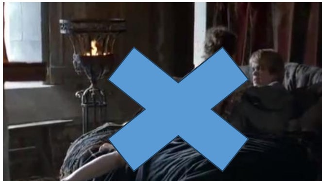
Gambar 2. Adegan yang menunjukkan bahwa Tyrion sedang akan berhubungan seks dengan pekerja seks (season 1, episode 1)

Gambar 1 di atas menampilkan tentang Tyrion Lannister sedang meneguk segelas wine, layaknya seorang yang sedang melepas dahaga. Secara conceptual structures , adegan ini merepresentasikan bahwa Tyrion adalah seorang difabel yang suka meminum wine. Adegan ini menawarkan ( offer ) informasi bahwa penggambaran Tyrion sangat berbeda dengan penelitian Barnes (1992) yang menyebutkan bahwa representasi difabel di media cenderung " as unable to fully participate in community life " (tidak dapat berpartisipasi penuh dalam kehidupan masyarakat), yakni kelompok difabel cenderung pasif dan tidak bisa berpartisipasi dalam komunitas. Sebaliknya, Tyrion digambarkan sebagai seorang difabel yang mampu tampil sebagai anggota masyarakat yang aktif dan bisa diterima kehadirannya di ruang publik.