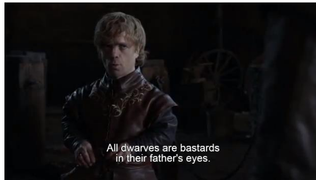
Gambar 4. Adegan yang menunjukkan bahwa Tyrion merasa dirinya adalah bastard di mata ayahnya sendiri (season 1, episode 1)