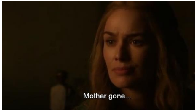
Gambar 9. Adegan yang menunjukkan hubungan Tyrion dengan saudara perempuannya Cersei (season 2, episode 2)

Tyrion hanya dipercaya sebagai seorang yang mengurus saluran air di Casterly Rock. Sebagai offer picture , dengan menggunakan angle long shot (menunjukkan seluruh badan atau pas dengan frame atau jarak jauh) pada adegan 3 dan 4, juga kalimat Tyrion yang mengatakan " when I reached mandhod, my father put me in charge of all the drains and cisterns in Casterly Rock. I never expected to have any real power " (ketika aku telah dewasa, ayahku menugaskanku untuk bertanggung jawab atas semua saluran air dan waduk di Casterly Rock. Saya tidak pernah berharap akan mempunyai kemampuan yang sebenarnya) menawarkan ( offer ) informasi bahwa Tyrion diperlakukan berbeda dengan kedua saudaranya Jaime dan Cersei dan keberadaannya sebagai anak tidak pernah dianggap oleh ayahnya sendiri. Kalimat ini juga semakin menegaskan apa yang Tyrion sampaikan kepada Jon Snow di atas bahwa " all dwarves are bastard in their father's eyes " (semua dwarf adalah haram dimata ayah mereka sendiri) Secara compositional meaning , dengan posisi Tyrion yang berada di sebelah kiri pada adegan 5 dan 6 sebagai bentuk dari given yaitu menggambarkan sesuatu yang telah ada di benak penonton, berisi information value , yaitu bahwa Tyrion adalah bastard di mata ayahnya sendiri.