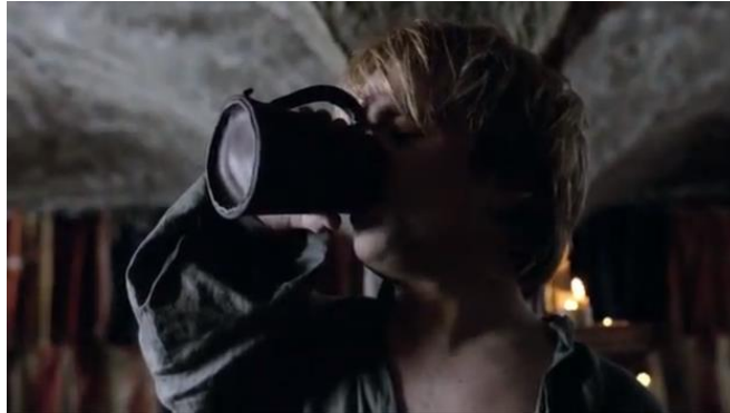
Gambar 1. Adegan yang menunjukkan bahwa Tyrion suka meminum wine (season 1, episode 1)

Gambar 1 di atas menampilkan tentang Tyrion Lannister sedang meneguk segelas wine, layaknya seorang yang sedang melepas dahaga. Secara conceptual structures , adegan ini merepresentasikan bahwa Tyrion adalah seorang difabel yang suka meminum wine. Adegan ini menawarkan ( offer ) informasi bahwa penggambaran Tyrion sangat berbeda dengan penelitian Barnes (1992) yang menyebutkan bahwa representasi difabel di media cenderung " as unable to fully participate in community life " (tidak dapat berpartisipasi penuh dalam kehidupan masyarakat), yakni kelompok difabel cenderung pasif dan tidak bisa berpartisipasi dalam komunitas. Sebaliknya, Tyrion digambarkan sebagai seorang difabel yang mampu tampil sebagai anggota masyarakat yang aktif dan bisa diterima kehadirannya di ruang publik.