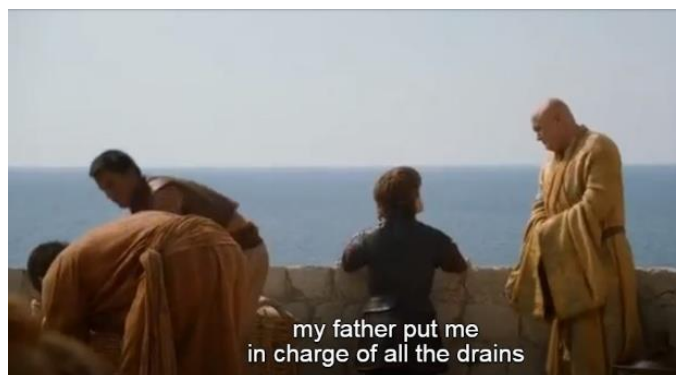
Gambar 8. Adegan yang menunjukkan bagaimana Tywin Lannister memperlakukan Tyrion Lannister sebagai anak

Gambar 7 di atas menampilkan Tyrion Lannister yang sedang menceritakan tentang dirinya yang pernah jatuh cinta dengan seorang perempuan bernama Tysha. Tysha adalah perempuan pertama dalam hidup Tyrion. Tysha merupakan pekerja seks yang dibayar dan diatur oleh Jaime sewaktu Tyrion berusia 16 tahun dengan tujuan agar Tyrion memiliki pengalaman seksual. Secara interactive participant antara produser dan audiens , adegan ini ingin menyampaikan bahwa kelompok difabel sama seperti mereka yang non-difabel yaitu bisa jatuh cinta dan memiliki sebuah hubungan romansa, dan bukan makhluk aseksual seperti yang selama ini media arus utama biasa tampilkan. Secara compositional meaning , dengan menggunakan angle close up dan penempatan Tyrion yang dominan berada di sebelah kiri sebagai bentuk dari given yaitu sesuatu yang sudah diketahui oleh audiens , mengandung makna bahwa seorang difabel akan selalu gagal bahkan mustahil berhasil dalam hal percintaan entah karena kondisi fisiknya, pasangannya, atau penolakan dari keluarga. Hal ini dipertegas oleh cerita Tyrion yang mengatakan bahwa ayahnya telah dengan sengaja melecehkan Tysha dengan menyuruh seluruh pengawalinya memperkosa Tysha di depan mata Tyrion sendiri untuk menunjukkan ketidaksukaan pada hubungan Tyrion yang menikahi pekerja seks.