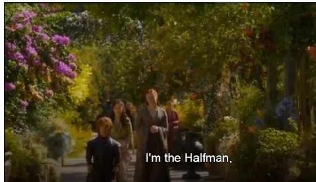
Gambar 3. Adegan yang menunjukkan bahwa Tyrion dijuluki sebagai The Halfman, The Imp, Little Beast, The Demon Monkey dan dwarf (season 3, episode 10)

kanan sebagai bentuk dari new information value bahwa Tyrion tidak seperti stereotip Barnes (1992) yaitu " the disabled person as sexually abnormal " (orang difabel tidak normal secara seksual) sehingga karakter Tyrion bisa dikatakan dapat merepresentasikan pengalaman dan orientasi seksual kelompok difabel dengan baik. Adegan ini juga menyiratkan pesan dari produser tentang kelompok difabel, bahwa mereka sama seperti yang manusia non-difabel lainnya.