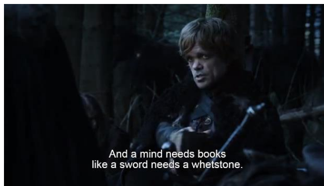
Gambar 5. Adegan yang menunjukkan bahwa Tyrion adalah seorang yang suka membaca buku. (season 1, episode 2)

Gambar 4 di atas menampilkan Tyrion yang merasa dirinya adalah seorang bastard di mata ayahnya sendiri. Penyebutan " bastard " oleh Tyrion sebenarnya menyakitkan hatinya sendiri dan kalimatnya yang mengatakan " all dwarves are bastard in their father's eye " (semua dwarf adalah haram di mata ayah mereka) adalah kalimat yang merasionalisasi statusnya sebagai seorang bastard . Sebagai offer picture , adegan ini menawarkan ( offer ) informasi bahwa sepanjang hidupnya, ia tidak pernah diperlakukan dengan baik walaupun ia adalah anak kandung. Pada adegan ini, terdapat interactive participant antara produser dan audiens yaitu pihak produser secara tidak langsung ingin menyampaikan tentang pengalaman pahit kehidupan seorang difabel terutama difabel seperti Tyrion yang selalu tersingkir dan terabaikan dari lingkungan bahkan dari keluarga sendiri. Secara compositional meaning , adegan ini menempatkan Tyrion di sebelah kiri sebagai bentuk dari given dan menggunakan angle close up yang menggambarkan sesuatu yang telah ada di benak penonton yaitu bahwa kondisi tubuhnya memberinya pengalaman sebagai seorang difabel. Bisa dikatakan dialog Tyrion tersebut adalah dialog yang sangat berani untuk disampaikan di suatu acara televisi.