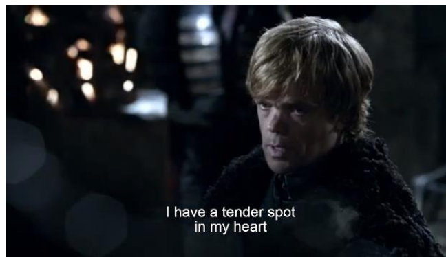
Gambar 6. Adegan yang menunjukkan bahwa Tyrion memiliki empati terhadap mereka yang tersingkirkan dan terabaikan (season 1, episode 4)

pengetahuannya dengan banyak membaca buku sebagai bentuk kompensasi atas kondisi fisiknya. Sebagai offer picture , adegan ini menggunakan angle long shot (menunjukkan seluruh badan atau pas dengan frame atau bisa juga diambil dengan jarak jauh) menggambarkan adanya pesan yang ingin disampaikan produser kepada seluruh audiens yaitu Tyrion beruntung terlahir sebagai Lannister, bangsawan yang terkenal karena kekayaan dan kekejaman, sehingga ia bisa memiliki akses sebanyak-banyaknya ke pendidikan. Sebuah privilege yang membuat Tyrion bisa mengakses, membaca dan memiliki koleksi buku. Kesempatan yang tidak akan Tyrion miliki jika terlahir sebagai orang miskin. Secara compositional meaning , penempatan Tyrion yang berada di sebelah kanan sebagai bentuk dari new information value bahwa seorang difabel bukanlah makhluk yang tidak " uneducated ", sebaliknya, sama seperti non-difabel lainnya, mereka suka membaca buku dan ingin mendapat pendidikan setinggi-tingginya, yang membedakan hanyalah aksesibilitas.