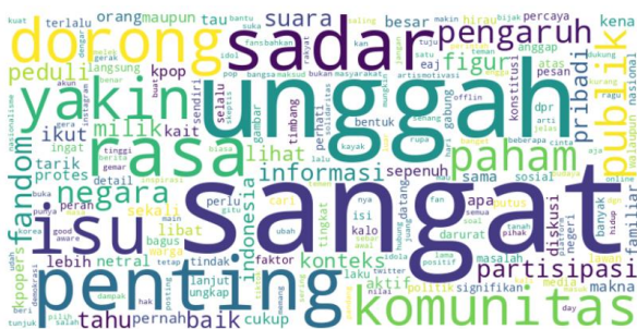
Gambar 1. Word Cloud Berdasarkan Pembobotan Kata (Witarti et al, 2025).

sentimen manifest yakni keterlibatan terbuka dalam diskusi publik dan kepedulian terhadap isu publik. Gambar 1 menampilkan kata-kata dominan sebagai ekspresi nasionalisme para fandom, menegaskan tingkat partisipasi digital yang tinggi (Witarti et al, 2025).