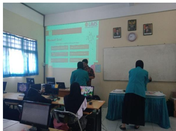
Gambar 1. Pendampingan Pertemuan Pertama di SMK Muhammadiyah Kartasura

Setelah memahami dan mencoba, peserta didik diminta untuk menuju ke Google Chrome . Masing-masing peserta didik mencari sejarah Muhammadiyah. Selanjutnya, peserta didik membuat PowerPoint dengan topik