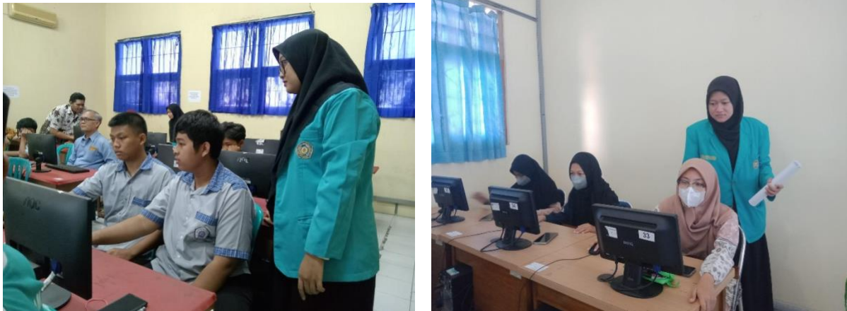
Gambar 2. Pendampingan Pertemuan Kedua di SMK Muhammadiyah Kartasura

sejarah Muhammadiyah. Dalam hal ini, peserta didik diminta untuk membuat PowerPoint menarik dengan memanfaatkan fitur-fitur yang sudah diajarkan. Dari kegiatan ini, peserta didik terlihat sangat semangat, karena peserta didik dapat memilih berbagai jenis PowerPoint yang menarik di bagian " Layout ". PowerPoint yang telah dibuat akan dikumpulkan ke dalam grup yang telah di buat sebelumnya.