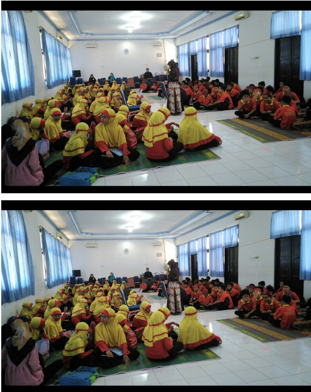
Gambar 2. Dokumentasi kegiatan intervensi

pada sesi terakhir, terdapat sesi foto bersama sebagai dokumentasi kegiatan.