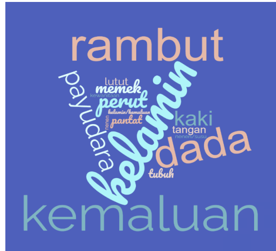
Gambar 3. Bagian tubuh yang sangat pribadi

Eksplorasi berikutnya yaitu mengetahui respon terkait cara yang dilakukan untuk menjaga bagian tubuh yang sangat rahasia tersebut. Hasilnya menunjukkan bahwa anak laki-laki cenderung menjaga dengan cara membersihkannya, mandi, memakai