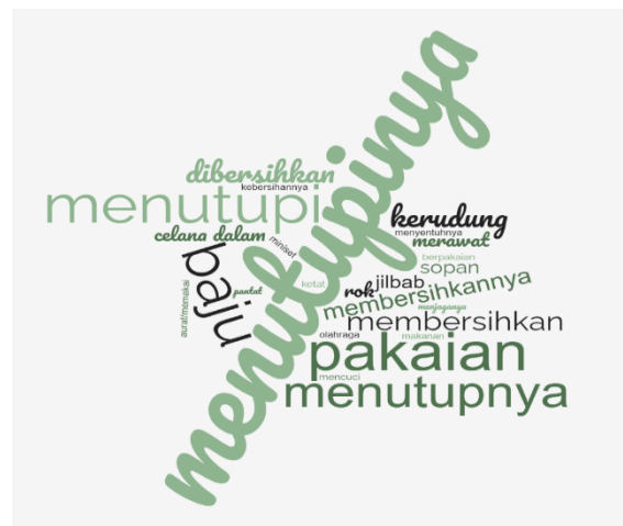
Gambar 4. Cara menjaga bagian tubuh

Terkait penggunaan gawai, 100% dari responden yang terlibat sudah memiliki gawai berupa smartphone dan laptop yang tersambung ke koneksi internet. Melalui angket kuesioner, ditemukan bahwa 21 dari 59 orang responden anak laki-laki pernah