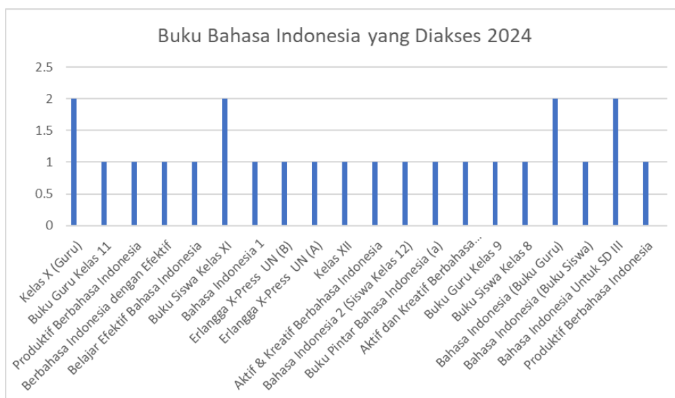
Gambar 2. Buku Bahasa Indonesia yang diakses tahun 2024

Dua grafik di atas menjelaskan data terkait penggunaan bookless. Berdasarkan laporan penggunaan Bookless Library Perpustakaan Wijang SMK Negeri 6 Surakarta yang telah kami dapat, menunjukkan pada tahun 2023 dari bulan Januari-Oktober terdapat 235 orang yang mengakses dan pada tahun 2024 dari bulan Mei-Agustus terdapat 3470 kali akses mulai dari siswa, tamu, dan guru. Berdasarkan data tersebut grafik 1 menunjukkan pada tahun 2023, ada 11/235 orang yang mengakses buku berkaitan dengan bahasa Indonesia dan grafik 2 pada tahun 2024