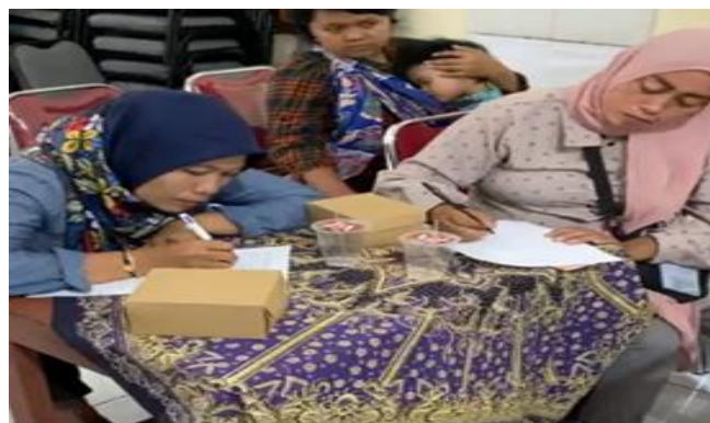
Gambar 4. Pengisian kuesioner post test

Setelah penyuluhan berakhir, e-book yang berisi tentang beberapa menu MPASI untuk bayi dengan kategori usia 6-8 bulan, usia 9-11 bulan, dan usia 12-23 bulan. Diharapkan dengan pembagian e-book ini, menambah pengetahuan ibu balita mengenai variasi menu MPASI, yang mana MPASI yang bergizi membantu pencegahan kejadian stunting.