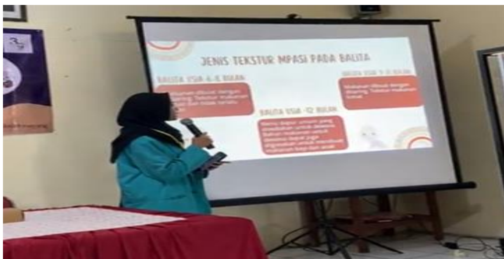
Gambar 2. Penyampaian materi MPASI