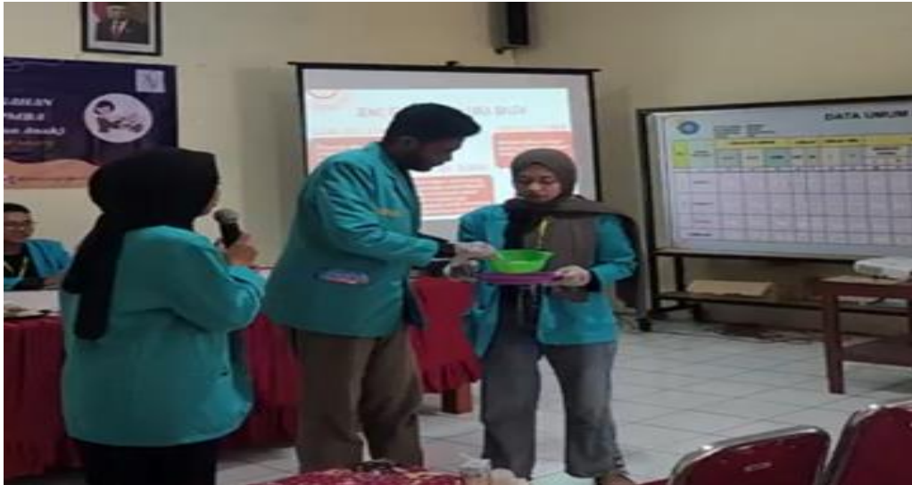
Gambar 3. Demonstrasi MPASI