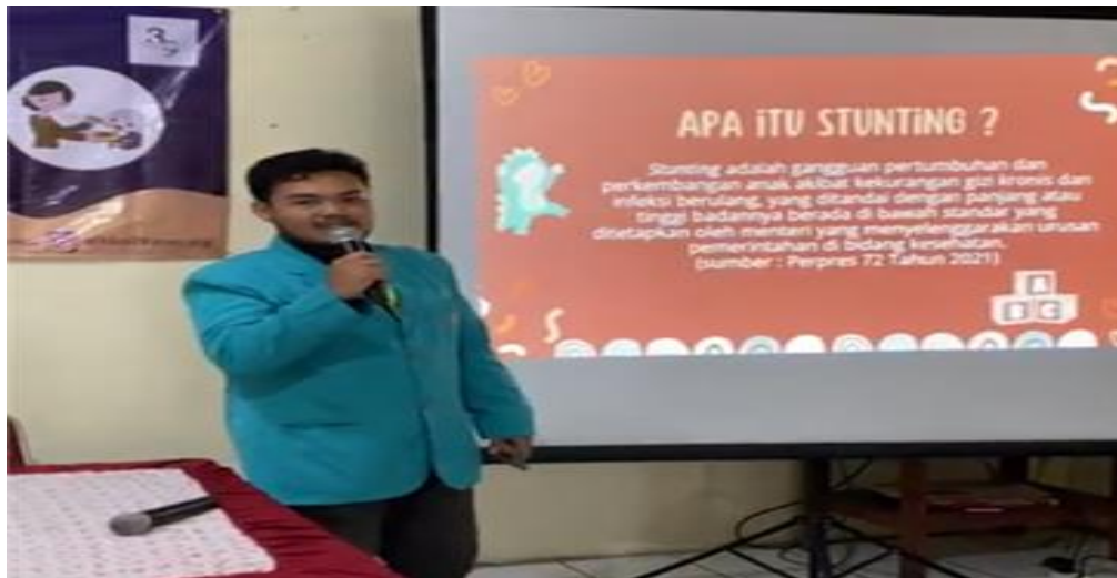
Gambar 1. Penyampaian materi stunting

Setelah itu, MC mengucapkan permohonan maaf dan terimakasih kemudian menutup kegiatan penyuluhan.