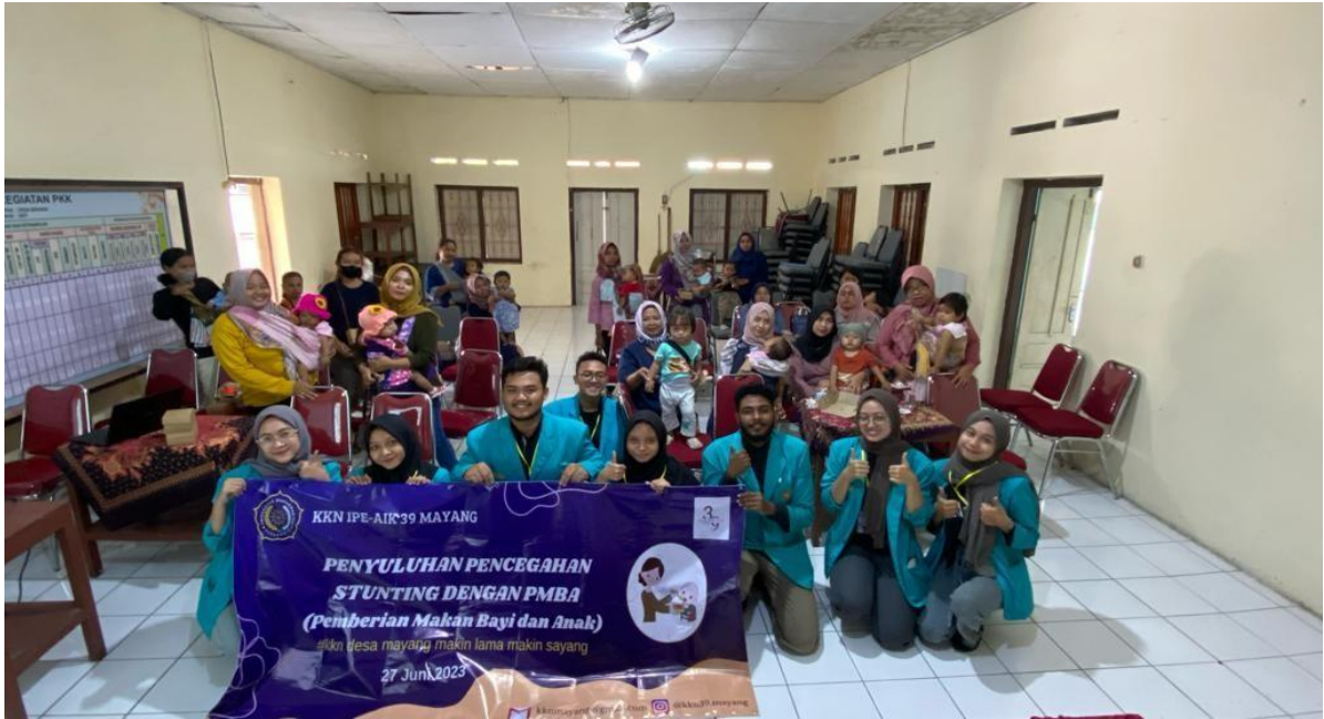
Gambar 5. Dokumentasi kegiatan penyuluhan pencegahan stunting