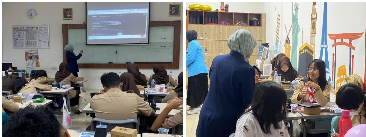
Gambar 4. Sesi demonstrasi pencarian informasi melalui internet dan penyaringan informasi dan sesi diskusi

kesehatan reproduksi yang didapatkan. Kegiatan dilanjutkan dengan sesi diskusi untuk kegiatan pengabdian. Beberapa peserta antusias bertanya dan berdiskusi terutama tentang IMS dan pencegahan kekerasan seksual.