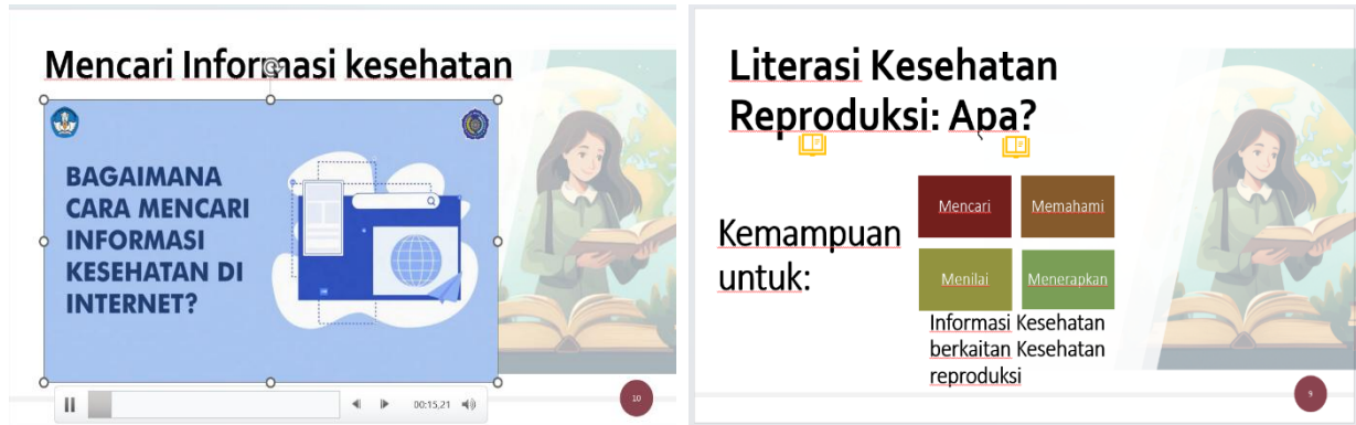
Gambar 1. Media edukasi audiovisual untuk edukasi peningkatan literasi kesehatan reproduksi

leaflet edukasi IMS dan cara pencegahannya. Video edukasi tentang kekerasan seksual. Materi edukasi literasi kesehatan reproduksi dan video edukasi demonstrasi cara pencarian informasi dan penyaringan informasi melalui internet.