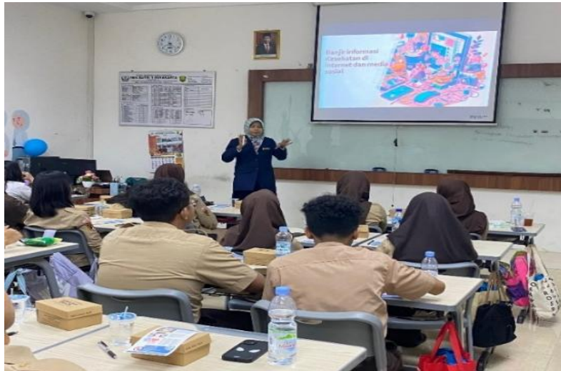
Gambar 3. Sesi materi edukasi kekerasan seksual, IMS dan peningkatan literasi kesehatan untuk pencegahan kekerasan seksual dan IMS

Setelah dilakukan pemberian materi, dilakukan kegiatan demonstrasi pencarian informasi kesehatan reproduksi pada sumber-sumber terpercaya dan cara melakukan penilaian terhadap kebenaran informasi