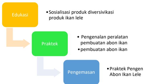
Gambar 3. Diagram Alir Langkah Penyelesaian