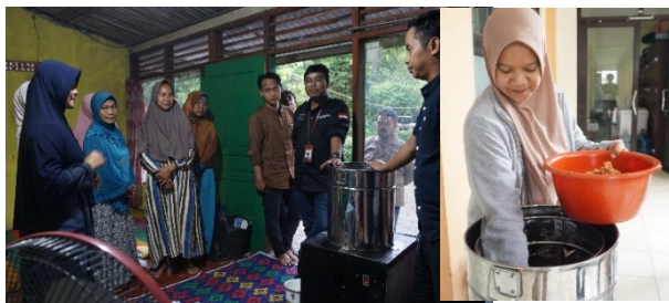
Gambar 5. Demonstrasi Penggunaan Mesin Spinner

didapatkan. Bahan untuk membuat abon ikan lele yaitu: ikan lele segar, santan, gula merah, gula pasir, rempah-rempah seperti kunyit, jahe, lengkuas, bawang putih, bawang merah, daun salam, daun serih, asam jawa. Peralatan yang dibutuhkan untuk membuat abon ikan yaitu dandang untuk mengukus lele, wajan, kompor, blender untuk menghaluskan bumbu, baskom, dan mesin spinner peniris minyak agar abon benar-benar tertiriskan minyaknya. Proses pembuatannya meliputi penyiangan atau pemotongan ikan lele dan pencucian daging ikan lele, pemisahan isi perut dan kepala, pengukusan daging ikan lele, pemisahan daging dari duri, pencampuran daging lele tanpa duri dengan bumbu rempah yang sudah dihaluskan, dilengkapi dengan asam, gula putih, dan gula merah. Proses selanjutnya adalah penggorengan. Selama proses penggorengan, secara terus-menerus dilakukan pengadukan agar abon ikan lele yang dihasilkan matang secara merata dan bumbunya dapat meresap dengan baik. Penggorengan ini akan dihentikan setelah serats-serat daging yang digoreng sudah berwarna kuning kecokelatan. Dalam kondisi panas dari wajan, langsung dilakukan penirisan minyak goreng dari abon ikan lele menggunakan mesin spinner . Demonstrasi penggunaan mesin spinner ditunjukkan pada Gambar 5 .