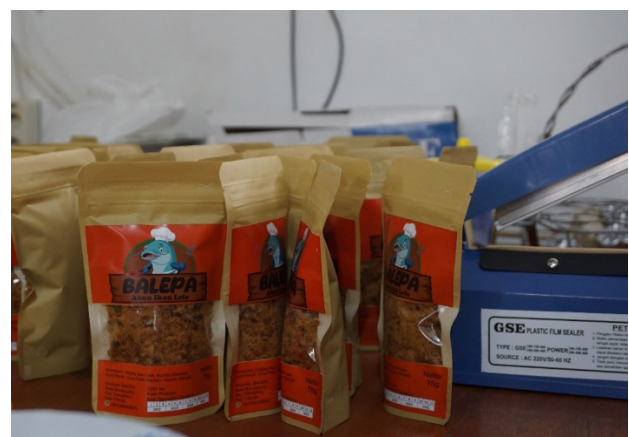
Gambar 7. Hasil Pengemasan Abon Ikan Lele BALEPA

Label kemasan harus ada disetiap produk. Kemasan yang baik yaitu kemasan yang tertutup dengan rapat untuk meminimasi kontaminasi dari luar, rapi, dan mempunyai label dengan informasi yang lengkap dan jelas sesuai dengan standar pelabelan kemasan. Abon ikan lele BALEPA yang sudah jadi dikemas dengan menggunakan kemasan standing pouch ecopack dengan berat isi 50 gram per pouchnya. Tim pengabdian juga memberikan pengetahuan terkait dengan macam-macam jenis kemasan dan bahannya. Untuk menjaga keamanan produk abon ikan lele BALEPA, kemasan di seal agar memastikan kemasan benar-benar rapat. Hasil pengemasan abon ikan lele dari pengabdian kami pada kelompok tani BALEPA ditunjukkan pada Gambar 6 .