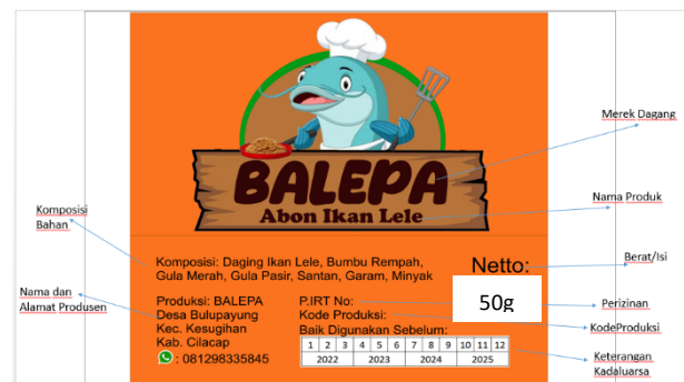
Gambar 6. Desain Label Abon Ikan Lele BALEPA

pelindung pada makanan, sebagai wadah, juga sebagai sarana komunikasi. Kemasan sebagai sarana komunikasi adalah untuk memberikan informasi yang ditulis pada label kemasan seperti nama produk, merek dagang, ijin edar, keterangan tentang halal, nama dan alamat yang memproduksi, tanggal, bulan dan tahun kadaluarsa, berat/isi, daftar bahan yang digunakan atau komposisi. Berikut adalah desain label kemasan abon ikan lele yang direkomendasikan untuk produk Kelompok Tani BALEPA dapat dilihat pada Gambar 6 .