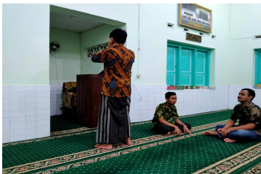
Gambar 2. Pre-Test Praktek Adzan

ada peserta yang mengumandangkan adzan dengan adab yang belum benar dan lafadz yang belum benar namun dinilai oleh para peserta lainnya atau sebagian peserta lainnya dengan penilaian yang bagus atau benar, maka mengindikasikan bahwa para peserta atau sebagian tersebut juga belum mengetahui adab dan lafadz adzan yang benar.