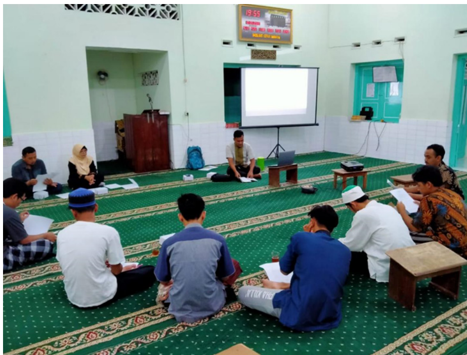
Gambar 3. Pemaparan Materi

اللَّهُمَّ رَبِّ هَذِهِ الدَّعْوَةُ التَّامَّةُ وَالصَّلَاةُ الْقَائِمَةُ أَتِ مُحَمَّدًا الْوَسِيلَةَ وَالْفَضِيلَةَ وَابْعَثْهُ مَقَامًا مَحْمُودًا الَّذِي وَعَدْتَهُ