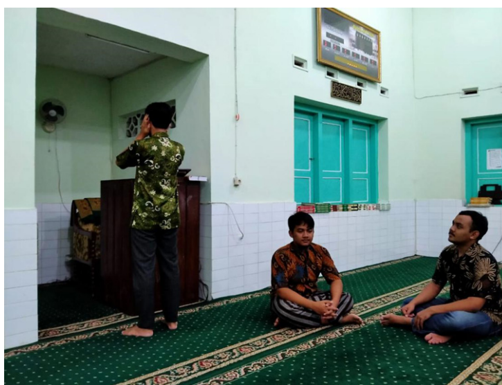
Gambar 3. Pelaksanaan Praktek Post-Test

Dalam post-test pelaksanaannya hampir serupa dengan pre-test , yaitu beberapa orang juga maju sebagai praktikan pada sesi ini, peserta yang tidak sedang praktik juga diminta memberi penilaian sesuai dengan materi yang telah diberikan. Pada akhir post-test , pemateri memberi contoh pengumandangan adzan yang benar.