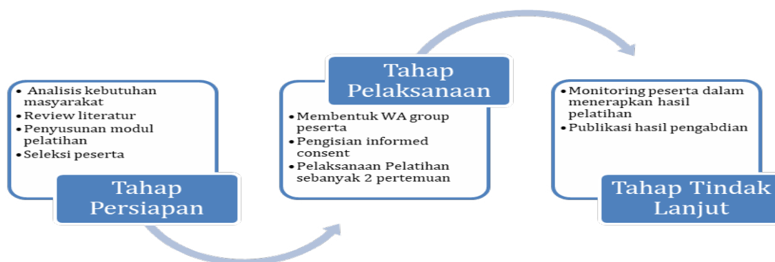
Gambar 1. Bagan Alir Proses Kerja

Kegiatan pengabdian masyarakat ini meliputi rangkaian proses yang diawali dari tahap persiapan atau perencanaan hingga tahap tindak lanjut kegiatan. Hal ini tampak dalam diagram alir berikut: