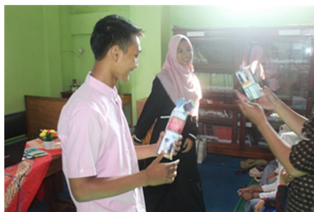
Gambar 3. Peserta tampil untuk public speaking

Peserta yang tampil diminta untuk menceritakan satu hal dalam kehidupannya di hari itu yang membuatnya sangat bersyukur, menceritakan pengalaman yang paling membuat terkesan dan pengalaman terburuk, memberikan improvisasi dan imajinasi dari objek yang dilihat didepannya, serta mendeskripsikan kelebihan peserta lain yang tampil di depan kelas.