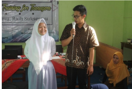
Gambar 2. Assessment oleh trainer

Kegiatan pengabdian ini diawali dengan assessment melalui observasi dengan memberikan stimulus kepada peserta agar bersedia menyampaikan pendapat secara singkat dan bergantian. Assessment tambahan diperoleh melalui wawancara singkat kepada guru pengampu mata pelajaran Bimbingan Konseling. Assessment dilakukan untuk mengklasifikasikan peserta yang sudah memiliki kemampuan public speaking yang baik dan yang belum. Sebagian besar peserta tidak mau secara sukarela maju untuk berbicara di depan, harus ditunjuk oleh trainer atau guru. Hasil assessment awal diperoleh bahwa siswa merasa malu jika berbicara di depan umum, grogi, merasa tidak percaya diri, terbata-bata, tidak tau harus berbicara apa dan tidak jelas dalam menyampaikan sesuatu. Para siswa merasa jika sudah di depan audiens mereka jadi blank , lupa apa yang akan disampaikan sehingga tidak fokus.