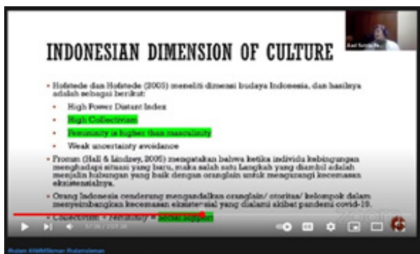
Gambar 3: Pemateri Menyampaikan Salah Satu Bagian Materi Kuliah