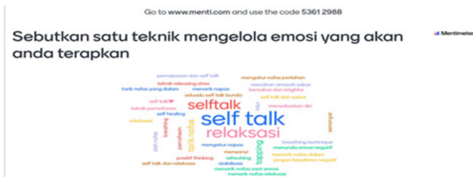
Gambar 5. Hasil Mentimeter setelah webinar

Dalam program pengabdian masyarakat ini dilakukan pula pengumpulan data evaluasi peserta melalui google form . Evaluasi peserta dikumpulkan setelah webinar dilaksanakan untuk mengetahui bagaimana kesan peserta terhadap pelaksanaan kegiatan webinar. Sebagian besar peserta memberikan kesan bahwa kegiatan webinar yang dilakukan menarik, menambah ilmu, wawasan, dan teknik pengelolaan emosi yang aplikatif dan relevan dengan kondisi guru serta orang tua saat pandemi. Berikut sampel tanggapan peserta: