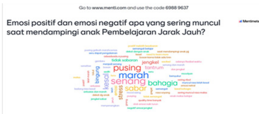
Gambar 2. Hasil Mentimeter sebelum webinar

Survey mentimeter ini dilakukan sebelum pemberian materi pada saat webinar berlangsung. Hasil mentimeter menunjukkan bahwa sebagian besar peserta merasakan emosi negatif berupa marah dan pusing, sementara emosi positif yang dirasakan adalah senang dan sabar seperti tertuang pada gambar 2.