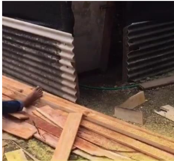
Gambar 3. Proses 1: pemotongan kayu

Proses pengerjaan pembuatan papan petunjuk arah jalan dusun ini memerlukan waktu 4 hari yaitu mulai tanggal 25 Agustus 2021 sampai dengan tanggal 28 Agustus 2021, dimana dalam jangka waktu tersebut telah sesuai dengan jadwal. Serangkaian proses mulai dari pembuatan hingga pemasangan papan petunjuk arah jalan dusun dapat dilihat pada gambar dibawah ini: