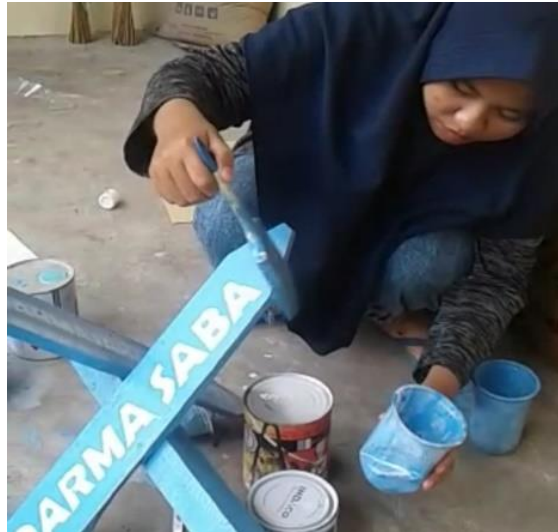
Gambar 6. Proses 4: pengecatan

Proses keempat yaitu proses pengecatan papan dan tiang penunjuk arah jalan dusun (Gambar 6). Pada proses pengecatan papan serta tiang ini menggunakan cat berwarna biru agar papan atau plakat dapat terlihat dengan jelas walaupun dari jarak yang cukup jauh. Pengecatan ini menggunakan cat yang telah dibeli di toko bangunan yang berada di Desa Keru. Proses pengecatan tersebut dilakukan oleh mahasiswa KKN MAS.