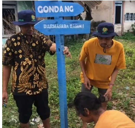
Gambar 8. Proses 6: Pemasangan papan arah jalan dusun

Proses keenam yaitu proses pemasangan papan arah jalan dusun (Gambar 8). Pemasangan papan arah jalan dusun dilakukan di 6 titik strategis yang telah ditentukan sebelumnya. Proses tersebut meliputi penggalian lubang tempat tiang papan yang akan ditancapkan. Setelah tiang ditancapkan, selanjutnya lubang tersebut ditutup menggunakan tanah dan batu. Langkah terakhir yaitu menyemen bawah tiang papan agar papan petunjuk arah jalan dusun dapat berdiri dengan kokoh.