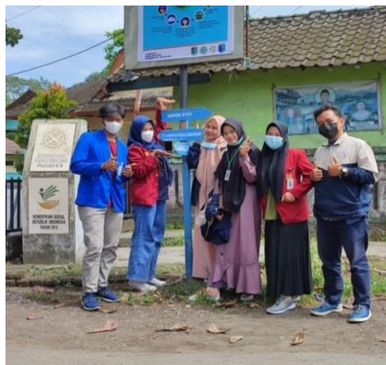
Gambar 9. Tampilan papan penunjuk arah jalan dusun

Proses keenam yaitu proses pemasangan papan arah jalan dusun (Gambar 8). Pemasangan papan arah jalan dusun dilakukan di 6 titik strategis yang telah ditentukan sebelumnya. Proses tersebut meliputi penggalian lubang tempat tiang papan yang akan ditancapkan. Setelah tiang ditancapkan, selanjutnya lubang tersebut ditutup menggunakan tanah dan batu. Langkah terakhir yaitu menyemen bawah tiang papan agar papan petunjuk arah jalan dusun dapat berdiri dengan kokoh.