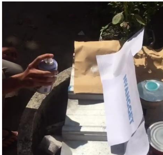
Gambar 5. Proses 3: pemberian nama

Proses kedua yaitu proses pemotongan papan (Gambar 4) dimana papan yang akan dipotong terlebih dahulu dihaluskan menggunakan mesin serut kayu yang berguna untuk menghaluskan bagian papan yang masih kasar. Kemudian, papan diukur panjang, lebar serta tebal sesuai desain yang telah ditentukan sebelumnya. Papan yang dipotong berjumlah 13 buah dengan ukuran yang sama dan ujung papan-papan tersebut dibuat runcing sebagai simbol petunjuk arah yang ditentukan.