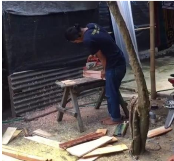
Gambar 4. Proses 2: pemotongan papan

Proses kedua yaitu proses pemotongan papan (Gambar 4) dimana papan yang akan dipotong terlebih dahulu dihaluskan menggunakan mesin serut kayu yang berguna untuk menghaluskan bagian papan yang masih kasar. Kemudian, papan diukur panjang, lebar serta tebal sesuai desain yang telah ditentukan sebelumnya. Papan yang dipotong berjumlah 13 buah dengan ukuran yang sama dan ujung papan-papan tersebut dibuat runcing sebagai simbol petunjuk arah yang ditentukan.