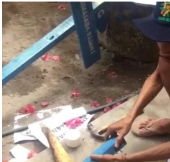
Gambar 7. Proses 5: perekatan papan pada tiang

Proses keempat yaitu proses pengecatan papan dan tiang penunjuk arah jalan dusun (Gambar 6). Pada proses pengecatan papan serta tiang ini menggunakan cat berwarna biru agar papan atau plakat dapat terlihat dengan jelas walaupun dari jarak yang cukup jauh. Pengecatan ini menggunakan cat yang telah dibeli di toko bangunan yang berada di Desa Keru. Proses pengecatan tersebut dilakukan oleh mahasiswa KKN MAS.